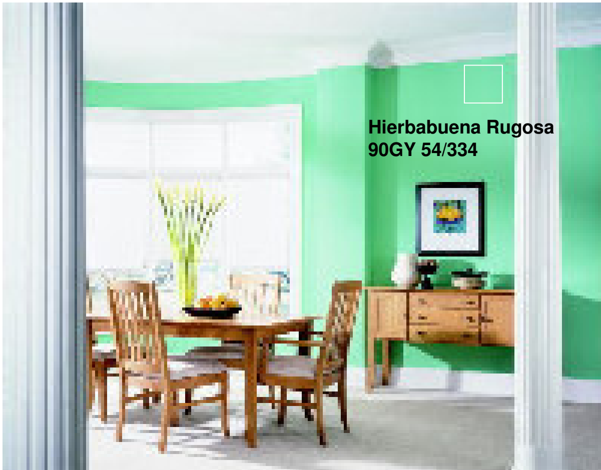
Hierbabuena Rugosa 90GY 54/334

Cuando los ambientes son muy luminosos y se eligen matices frescos, los colores tienden a una apariencia "fluo". Se aconseja aplicar productos de terminación opaca, como el ALBALATEX MATE.