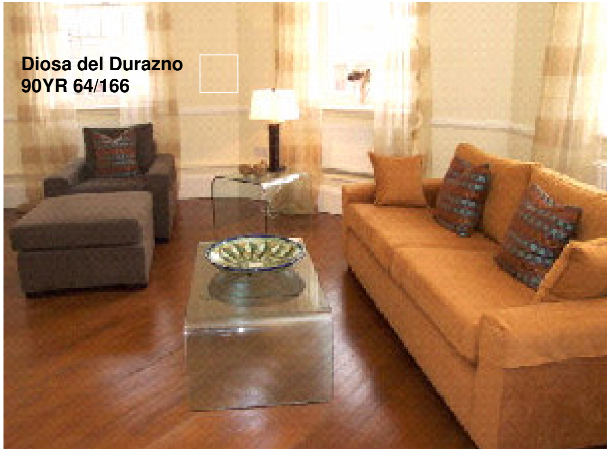
Diosa del Durazno 90YR 64/166

La gama de completa de la paleta naranja cálida, desde sus colores mas intensos hasta los más pasteles unidas a las texturas opacas y aterciopeladas, como los textiles de Pana, resaltan sobre estos pisos de alto brillo.