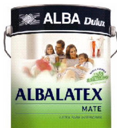
Luz Silenciosa 60YY 65/082

El uso de los amarillos calmos favorece la sensación de una serenidad y elegancia, asociada al un bienestar proveniente del calor que nos aporta la naturaleza. Estas paletas son minimalistas y combinan con accesorios y textiles simples y confortables. No hay lugar para la sobrecarga de estímulos.