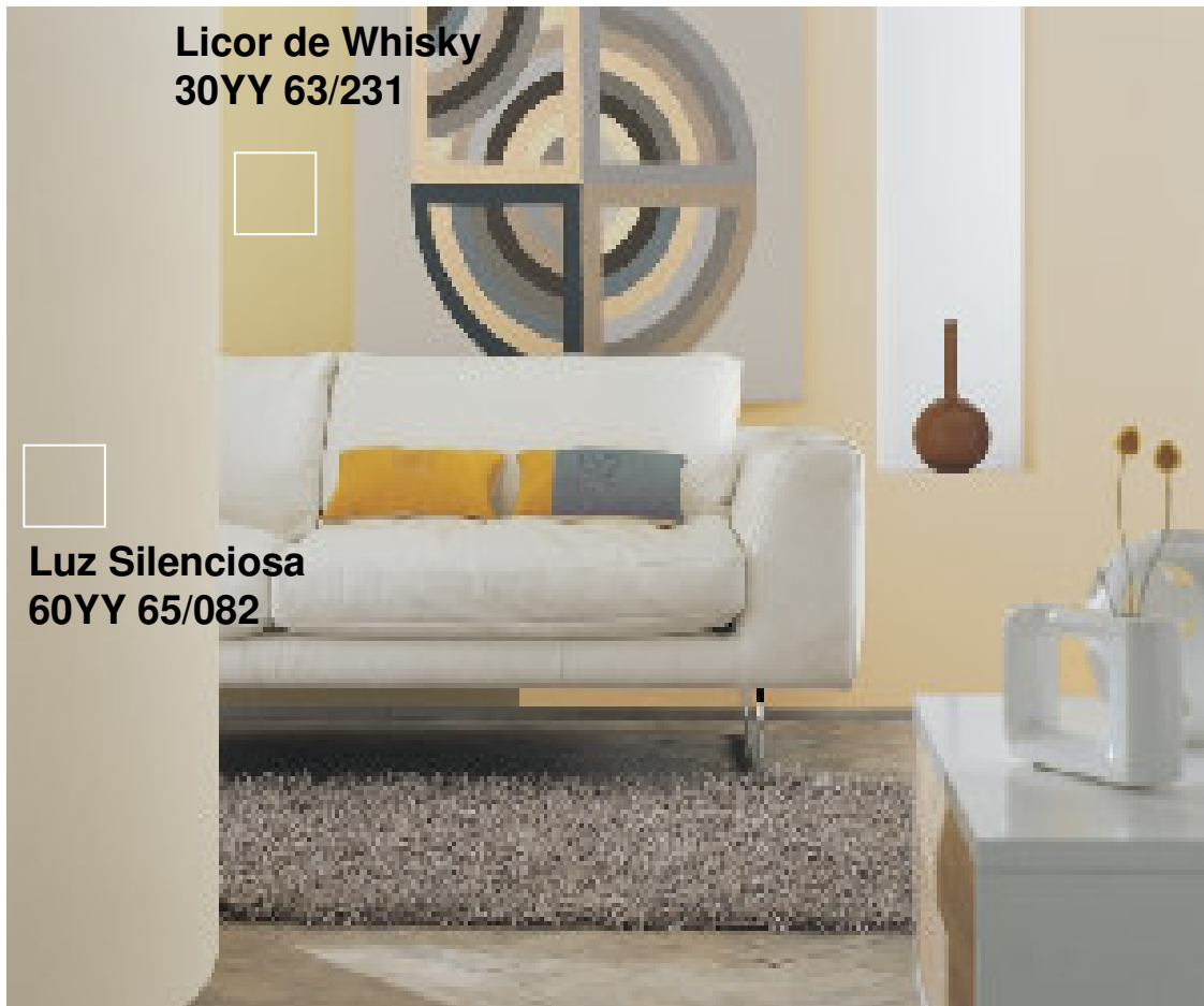
Licor de Whisky 30YY 63/231