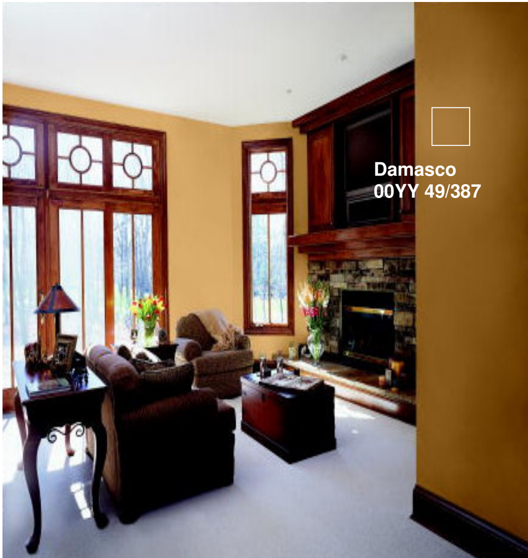
Damasco 00YY 49/387