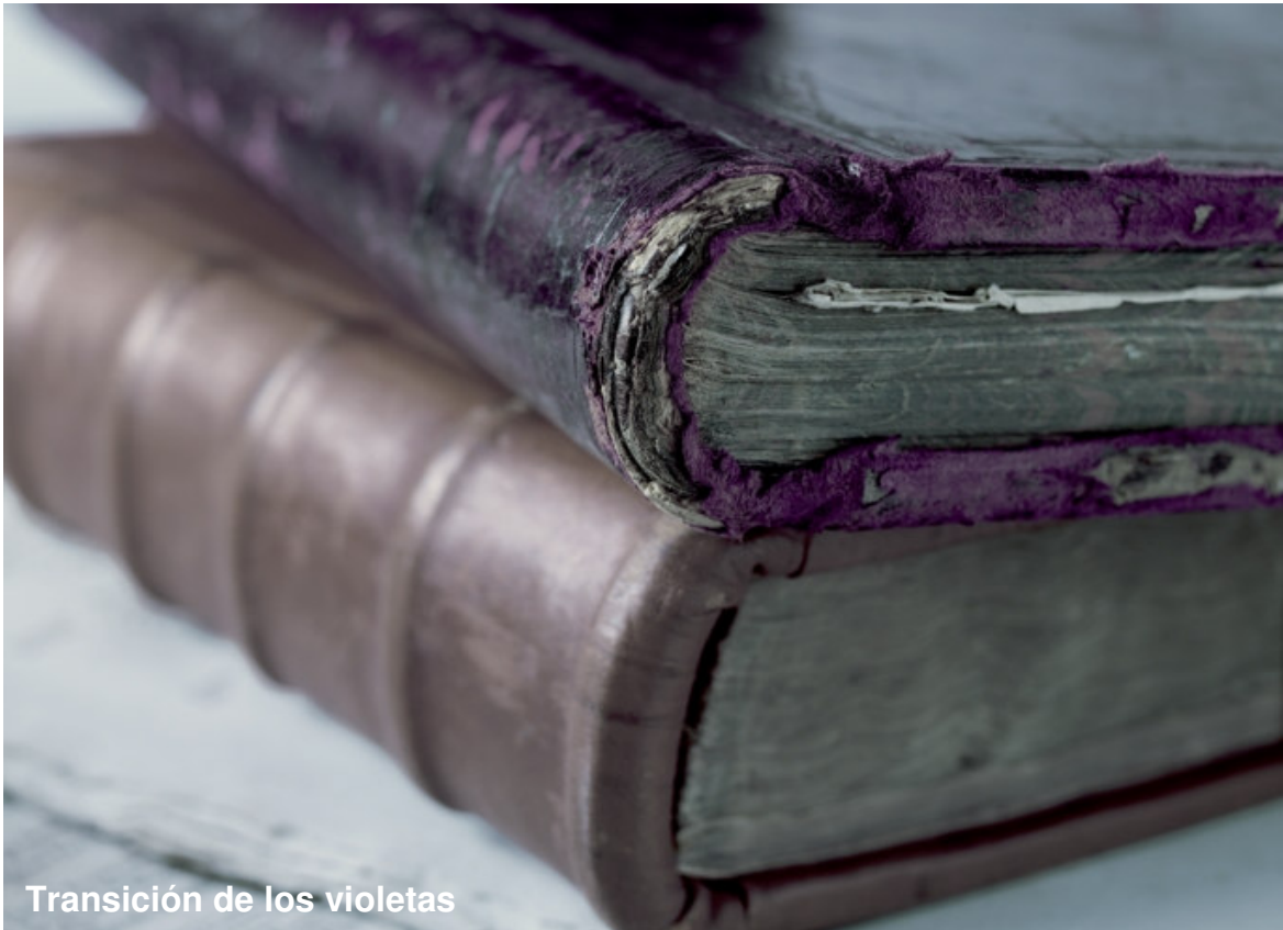
Transición de los violetas

Un movimiento hacia los púrpuras más certeros que son ligeramente más azulados que el año pasado – tonos más profundos inspirados en telas ricas y opulentas.