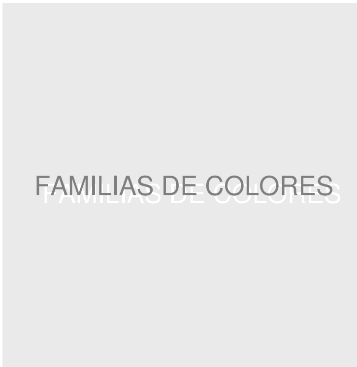
neutros cálidos neutros cálidos