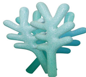
Flujo y reflujo