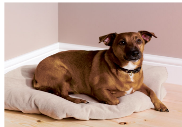
neutros cálidos neutros cálidos