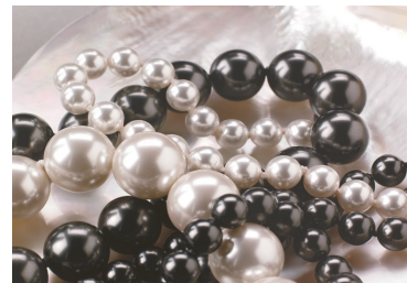
Neutros fríos Neutros fríos