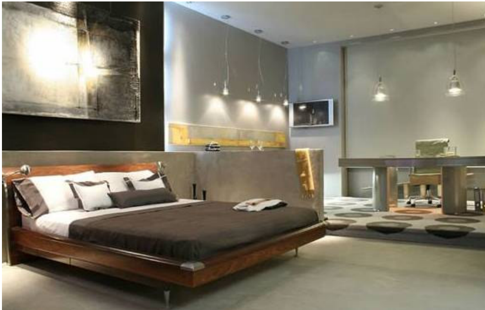
Dormitorio para un hombre con escritorio, diseñado por Claudia y Marina Goldaracena, para Casa FOA 2006.

Los colores neutros cálidos , naturales, como los de madera, habano, crudo, maíz, beige, etc., transmiten tranquilidad y quietud.