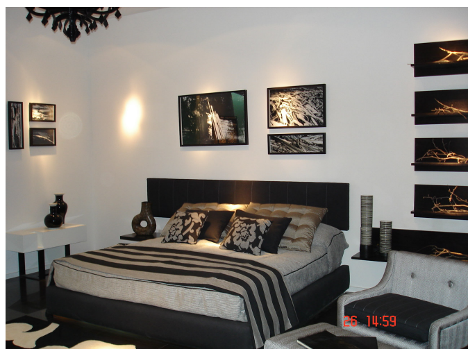
Dormitorio con Baño, Diana Reisfeld, Casa FOA 2006